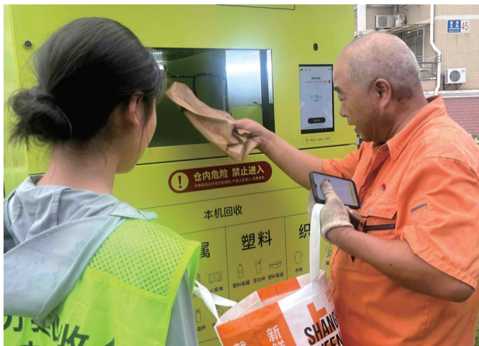
市民向智能回收机投放纸板。

回收物经中转运输,进入末端分拣工厂后,将对回收物进行精细化分拣。所有可回收物在集散场会被精分成80个类目进行处置,其中织物和塑料部分,分别进入粗加工厂进行加工。其余可回收物则销售给下游商家,实行市场化运作。目前,分拣工厂已经成功实现了塑料分拣的自动化升级。