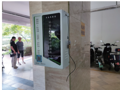
遭到破坏的充电桩。

晚报讯 我市新城小区31幢楼下的电动自行车充电桩突然不翼而飞,小区业主遭遇充电难。昨天下午,小区多名居民拨打110报警求助,文峰派出所已就此事展开调查。