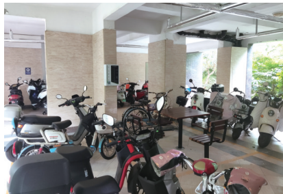
涉事现场。

记者了解到，物业、业主都表示“充电桩不是他们拆除的”，那么，这桩蹊跷之事到底是谁干的呢？目前，辖区警方仍在继续调查了解之中。 记者周朝晖 张园