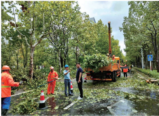
园林绿化处工作人员正在清理倒伏树木。

为做好台风“贝碧嘉”防御工作,市园林化管理处启动橙色预警应急响应机制,38支应急抢险队伍、760余名