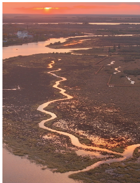
三江口国家湿地公园美丽夕照。