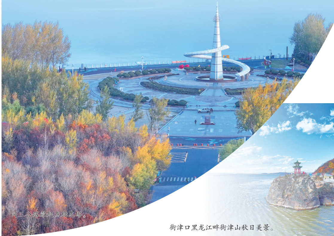
同三公路零起点标志塔。