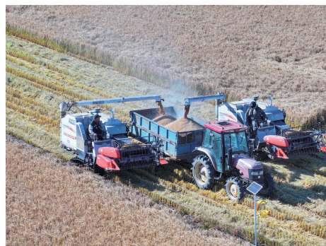
北国粮仓收获繁忙。