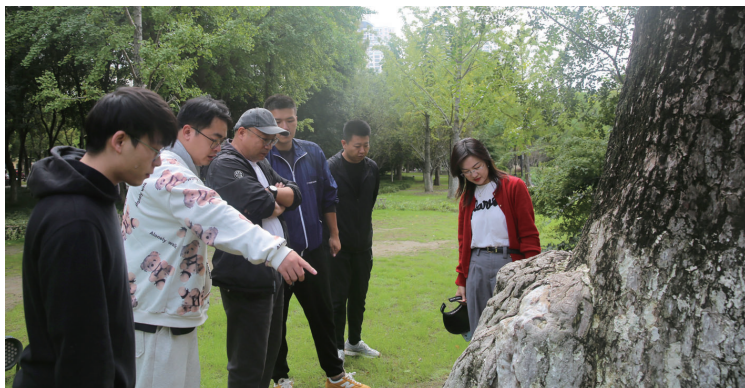
现场察看古树名木。

濠河景区内共有古树名木70棵，其中一级26棵、二级44棵，树龄最长的超过700年。树木品种有银杏、朴