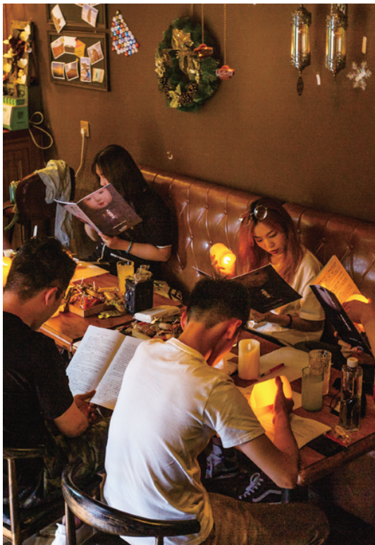
年轻人在玩剧本杀。

前段时间,“剧本杀为什么没人玩了”“剧本杀怎么不火了”等话题冲上热搜,日前,话题点击量、讨论量达到高点,点击量突破7000万。南通剧本杀现状怎样?15日,本报记者就此展开专访。