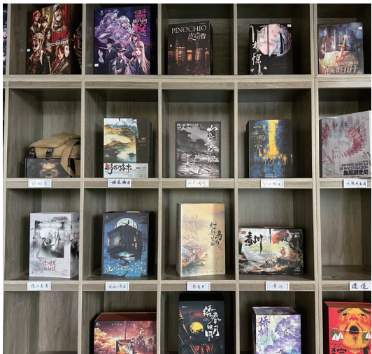
淘普文化引进和创作的部分新剧本。记者张园