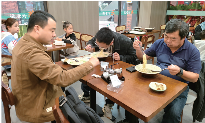
社区食堂的鱼汤面让市民们食指大动。