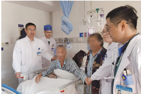
高龄患者夫妇成功手术后,同日康复出院。

市肿瘤医院食管癌MDT团队成立于2021年1月,由胸部放疗科、胸外科、肿瘤内科、影像科、病理科、内镜室等专家组成,全面