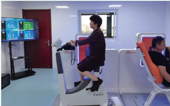
启东市汇龙镇中心卫生院基层慢病筛防中心。