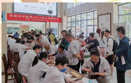
推广健康养生方式,倡导“四季养生”理念。