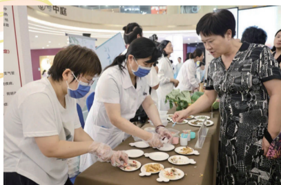
举办中医药文化夜市,弘扬“膳食养生”。