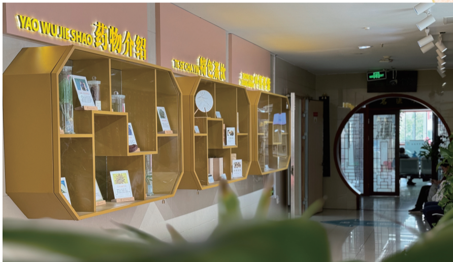
建设路院区中医药氛围浓厚,新装修的中医名医馆即将与市民见面。

目前,在院部统一筹划下,医院两院区并轨运行日趋成熟,呈现双擎驱动、共同发展的良好开局。其中,东院区(建设路院区)以中医药特色为核心,西院区(孩儿巷院区)则提供中西医综合诊疗服务。双院区各具特色,在服务地区百姓健康需求方面正展现出独有的核心竞争力。