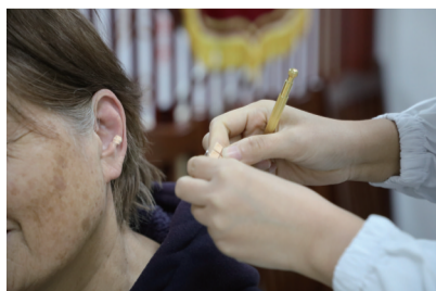
普及中医特色适宜技术,助力“健康惠民”。