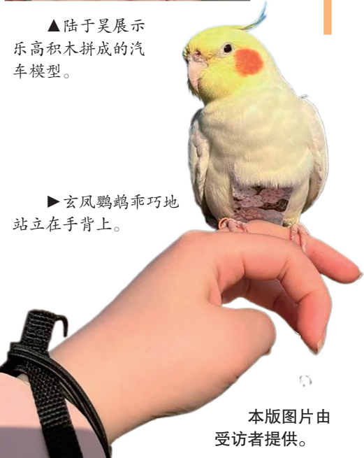
▶玄凤鹦鹉乖巧地站立在手背上。