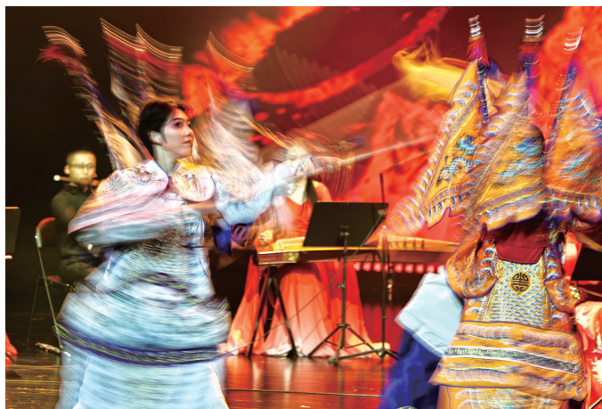
昨天下午,南通市青年艺术人才技能汇演出现场。记者徐培钦

晚报讯 昨天下午,2024南通市青年艺术人才技能展示颁奖仪式暨汇报演出在南通开发区能达剧院举行。南通市能达初级中学400多名师生观看演出。