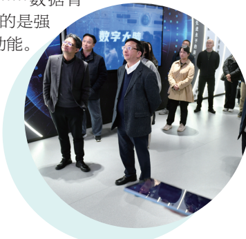
参观浙江清华长三角研究院