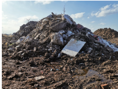
现场堆放的垃圾。

记者于12日下午赶到实地展开调查。记者看到了一处紧邻农田的空旷地带，地面有一个呈长方形被挖开的大洞，洞内渗出了不少积水，记者从横剖面看到了参差不齐、层层叠叠压在土中的报废石材等建筑垃圾，还有一些塑料袋等异物。在现场南侧，一台作业机械正在工作中，3名戴着安全帽、穿着工作服的技术人员正在钻