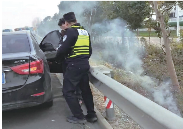
事发现场。通讯员顾希玮

晚报讯 20日,沈海高速丁堰段发生惊险一幕:一名驾驶员将车停靠应急车道后竟在高速边坡烧纸祭祖,好在民警及时发现制止,未酿成严重后果。