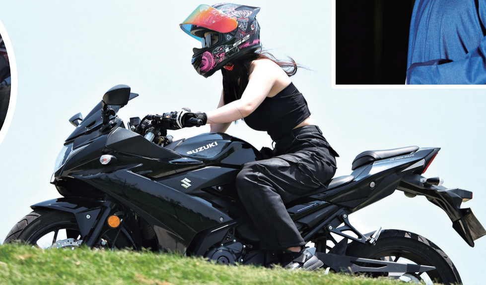
测试车辆的爬坡能力。