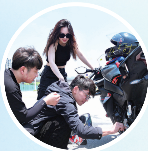
与摩友商量摩托车养护。