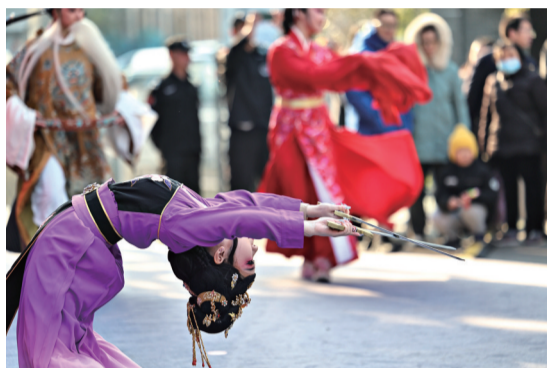
在“城南乐事”城南别业冬日游园会上表演。