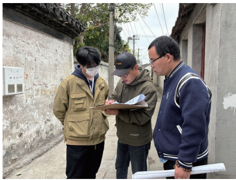
区普查队队员走进寺街。

作为南通的主城区、历史文化遗产的“富矿”,崇川区自去年5月“四普”工作转入实地调查阶段以来,依托测量建筑数据、推进本体CAD落图、绘制建筑平面图、强化影像图片记录等技术手段,对辖区文物遗存进行全方位的数据资料采集、登记工作,扎实推进全区“文物资源一张图”编制。目前,崇川区已完成范氏祖居、老城隍庙、红英巷7号住宅等419处文物点位的复核登记,普查中新发现丁瓚故居、南通港候船大厅、唐闸新工房等具有较高历史文化价值的遗存52处。