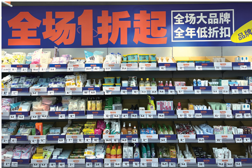
嗨特购店内折扣商品展陈。记者陆薇

去嗨特购、好特卖购物,体验线下版拼多多;从“惜食魔法袋”预订面包盲盒,晚间自提,价格只有正价的一半;在盒马鲜生、大润发,捡漏黄色标签商品……记者调查发现,当折扣化浪潮席卷零售行业,临期食品犹如打开“新世界”的大门,吸引了越来越多的消费群体。令人心动的价格背后,既有商家保本或者谋利的机遇,也是市民消费习惯的转变。