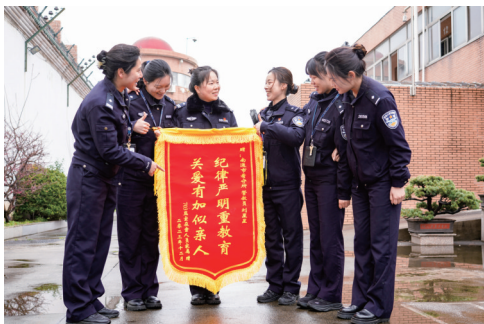
管教们用真心换真心,在押人员出所后送来锦旗感谢。