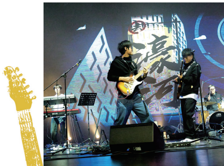
激情四射的“南瓜马车”乐队。