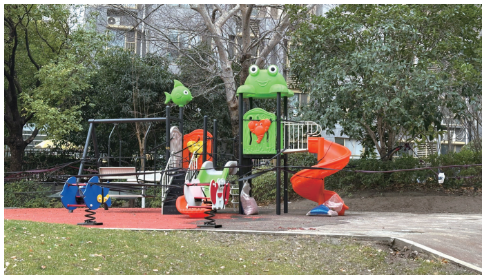
尚海湾新建的儿童游乐设施。