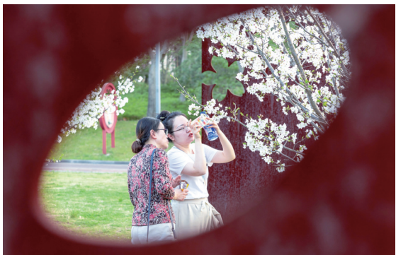
3月25日,海门江海公园里樱花盛开,吸引了一对母女赏花拍照。 宋武斌