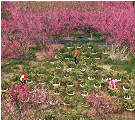
3月11日,如皋市万禾生态园梅林中,红梅开得正艳,几个村民在园内松土,一幅色彩浓郁的田园劳作图定格眼前。 王晓峰