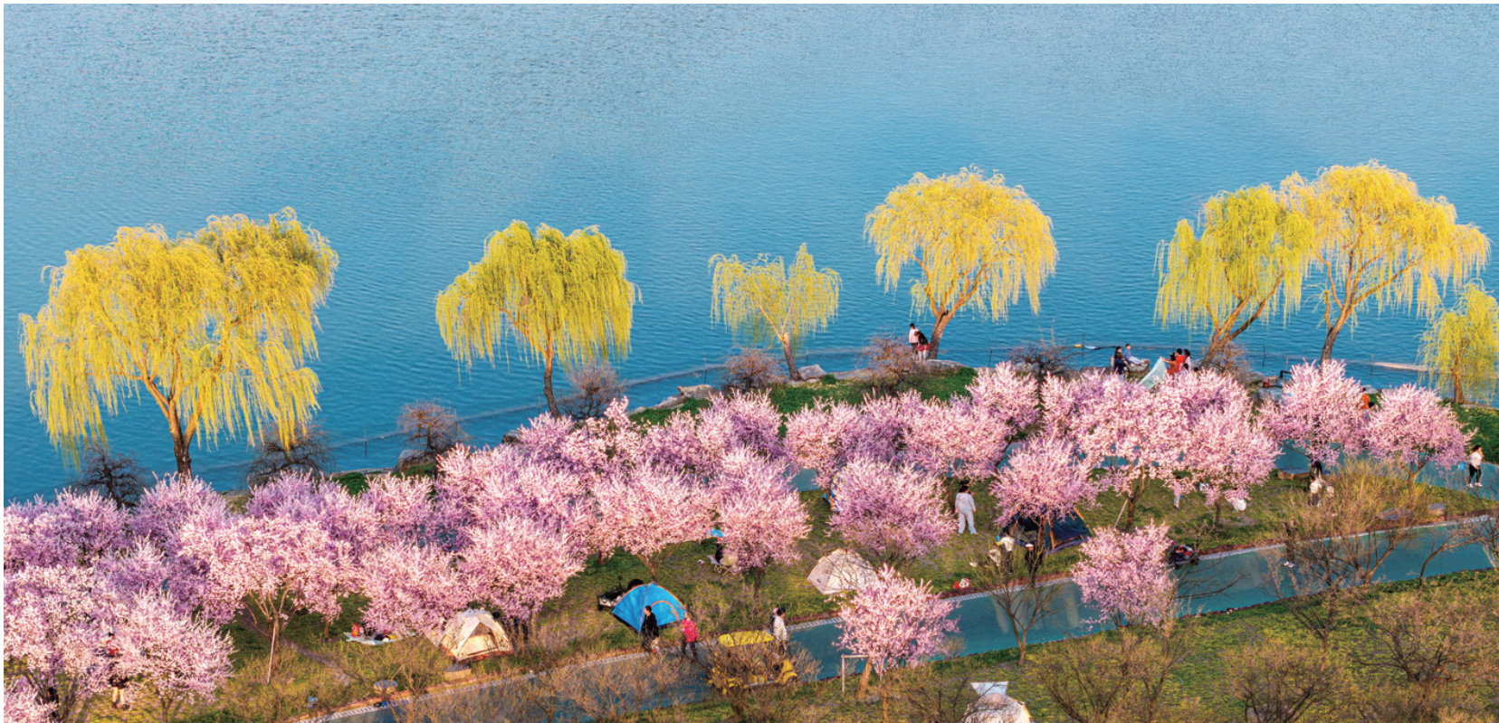
三月二十二日,南通洲际梦幻岛一处水岸,碧水、绿树和开得十分灿烂的美人梅,以及草地上游客们搭起的帐篷,构成一幅优美的图画。 范鑑毓