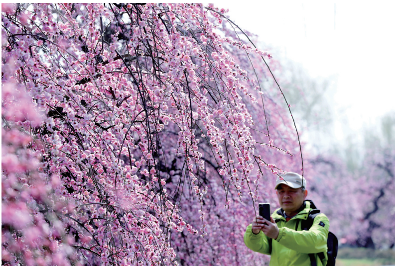
3月2日,南通洲际梦幻岛,一名游客用手机记录春日繁花之美。 宋协培