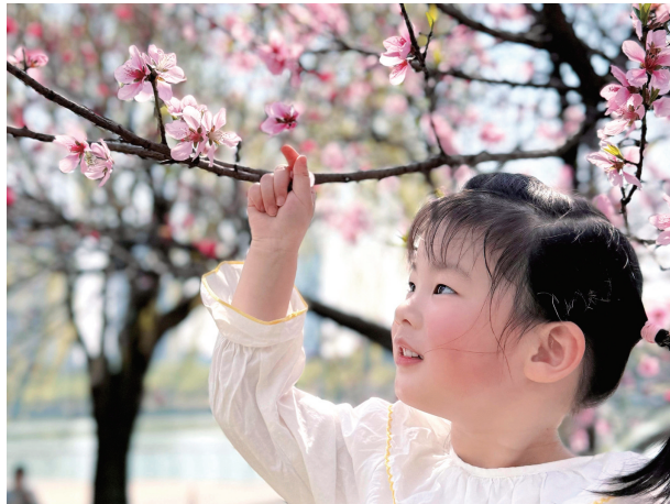
三月二十六日,市区通吕运河北岸路边,一名小女孩被眼前盛开的桃花所吸引。 朱进清