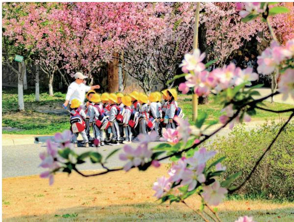
三月二十六日,南通森林野生动物园,市机关第一幼儿园的小朋友在老师带领下春游。 瞿德均