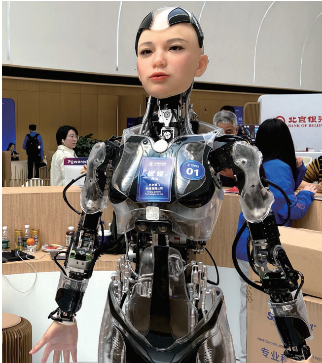
3月29日，在2025中关村论坛年会上，两个负责前台迎宾招待的人形机器人。

在中关村国际创新中心内，人形机器人“夸父”每天都很忙，它承担着迎宾工作，为公众解答疑问、提供讲解和指引服务等，碰到有人问路也能自如为其带路。