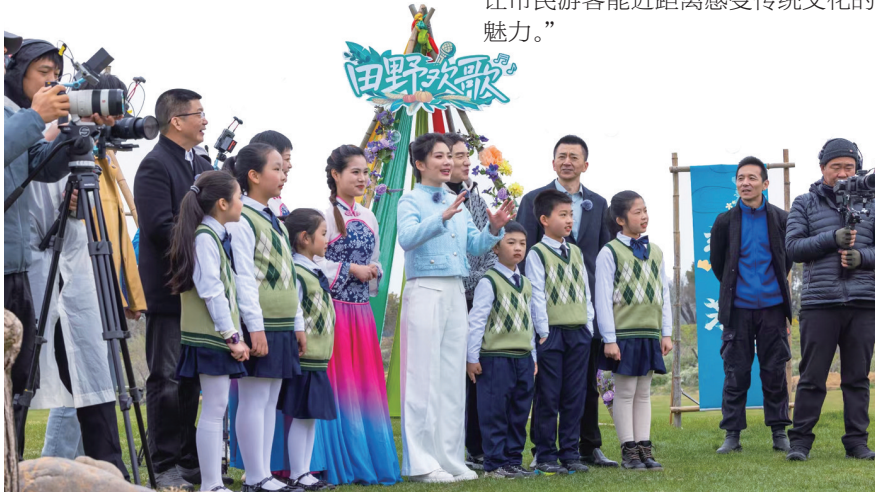
欢歌团近距离感受海门山歌的魅力。