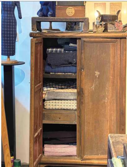
▲南通土布展示。 ▲小院到钟楼只要99步。