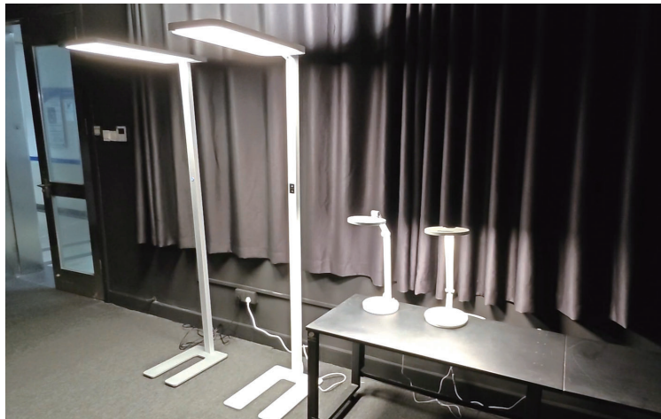
大路灯(左侧两款)体积较大、照明范围广。

近期,“落地护眼灯”受到家长群体的追捧,因其形状酷似街边的路灯,也被称作“大路灯”。记者走访发现,大路灯的价格从几百元到近万元不等,还有一些大路灯号称其“能护眼”“防近视”。大路灯是否真的能防近视?如何从改造灯光的角度帮助孩子防控近视?防控近视还有哪些值得注意的?