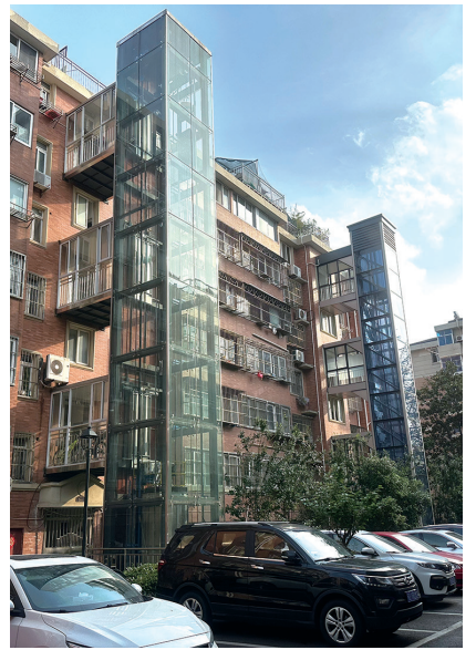
▲新城桥街道段家坝小园

在技术保障方面,实施意见鼓励采用智能化手段提升安全管理水平,推荐加装具备运行参数采集、信息网络传输、