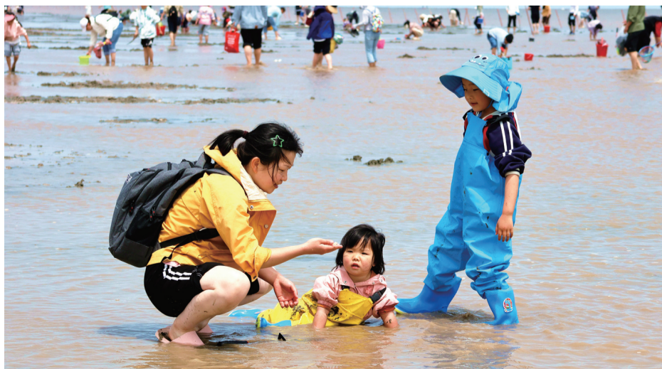
五月四日,启东市黄金海滩景区迎来大批游客,人们在海滩上挖宝、拍照,体验赶海的乐趣。 施建冲