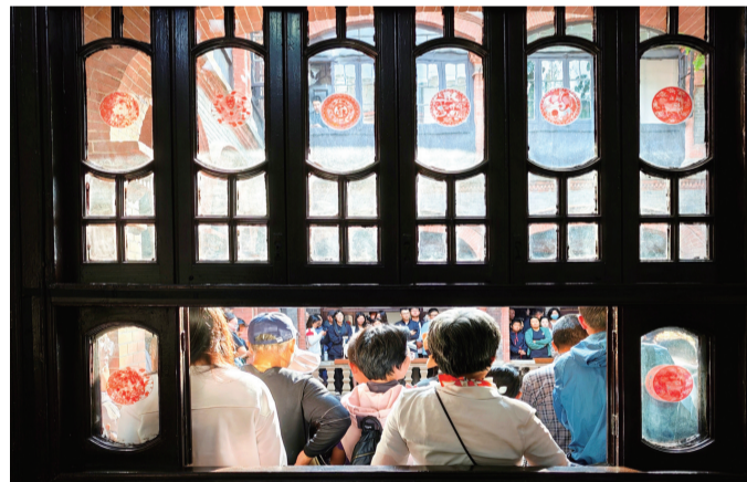
5月2日,市区城南别业内院。5月1日至5日,“城南乐事·听见旧时光”音乐嘉年华在市区城南别业精彩开唱,连续五场共50余首经典曲目吸引大批市民和游客驻足欣赏。 蔡田新