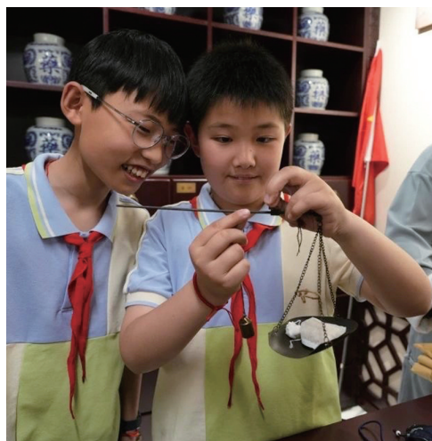
“小郎中”学习中药材称重。