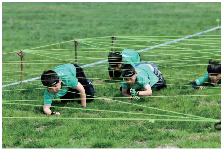
孩子们在比赛中。彭长青

晚报讯 昨天上午,2025DS自然探索赛南通站在苏锡通园区枫叶小镇奥特莱斯开赛。1200余名4至14岁的“小勇士”在家长们热情如潮的加油声中,勇敢征服泥泞赛道,共同点燃了一场席卷江海大地的“泥巴嘉年华”。今天,还将有800余名选手继续挑战,这场精彩的自然探索之旅将持续两天。