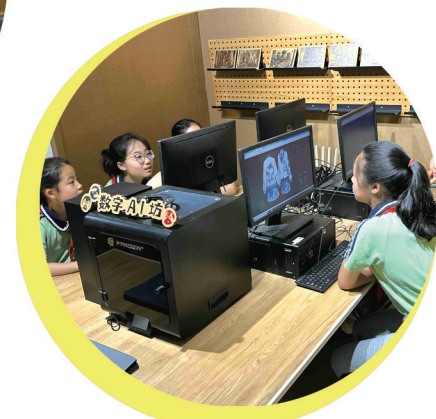
数字AI坊中,学生利用设计软件更便捷地进行创作。

虹桥小学是南通第一所新村小学,建成时间早,校园面积狭小。在先天性条件不足的情况下,校方“螺蛳壳里做道场”,借助崇川区老旧小区改造及崇川区“一校一品”特色项目建设,腾挪空间、创设情境、自主研发特色美育课程,创办“摄影”“蓝晒”“泥塑”“剪纸”“版印”等美术社团,使用各色场地开展各类美育实践活动,让学生在真