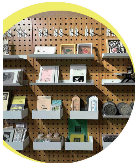
艺术工坊墙上展示着学生设计作品及所用工具。

的氛围。她手中的刻刀灵活游走,将古老的纹饰重新诠释。在一墙之隔的AI坊里,学生们通过算法生成属于数字时代的纹样新解,“总能找到一处任自己发挥的沉浸式空间”。