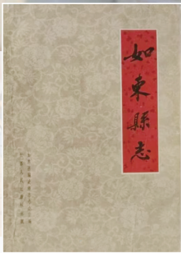
新中国第一部地方县志《如东县志》

1957年秋,南通一座中国东部沿江小城里的“永泰仁”杂货店还像原来一样照常营业,一年多前,这个店已完成了公私合营,成为南通副食品公司门市部,大多数员工留用,谁也不会注意到一个来自如东县掘港镇的年轻店员,他每天晚上负责看店,没有像其他伙计一样晚上早早休息,而是秉烛读书、查阅资料,他正在编撰有史以来第一部完整的掘港地方志书。