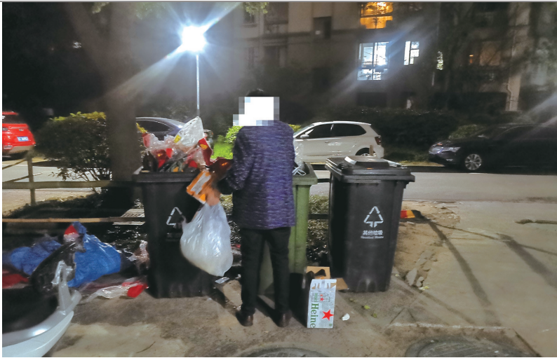
我市一小区,老人在翻捡垃圾。记者周朝晖

在一些小区楼下,时常可见这样的情形:一些头发花白的老人弯着腰,双手在垃圾桶里捡拾垃圾,挑出可以回收的物品后,没用的垃圾到处乱扔;还有的老人将翻找出来的纸盒、塑料瓶堆积在楼道等小区公共区域,引来不少业主投诉。老人在小区内翻垃圾带来的一系列卫生及安全问题让不少业主及管理者头疼。