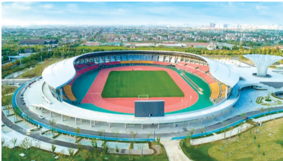
南通足球训练中心海门基地。