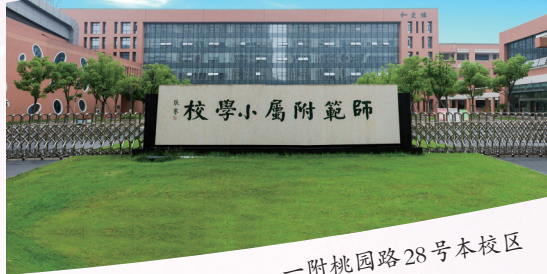
一附桃园路28号本校区

1905年，清末状元、近代著名爱国实业家、教育家张謇先生在南通创办了中国最早的师范附属小学——通师一附。