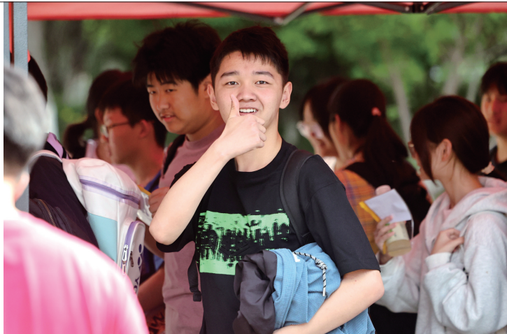
考生轻松应考。

昨天上午,2025年南通市中考拉开帷幕。记者走访多个考点发现,考点外上演着一幕幕温情的“陪考”故事,家长、志愿者和各部门工作人员用各自的方式为考生保驾护航。