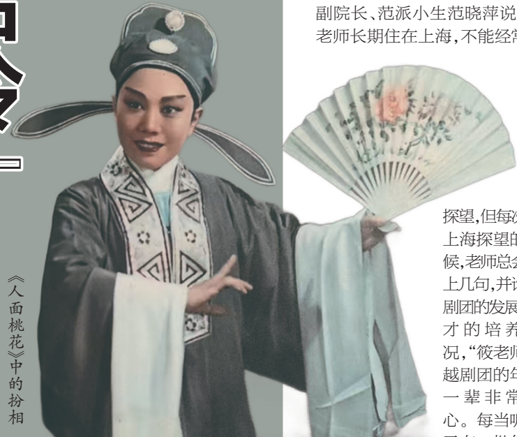
《人面桃花》中的扮相