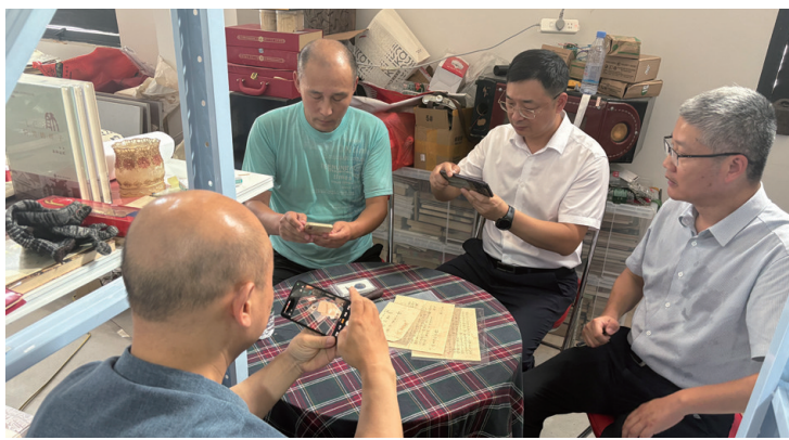
南通市党史办、南通市档案馆专家正在对资料进行考证。

1938年3月17日,日军强行登陆南通。横山久男的信件中详细介绍登陆过程:当天天亮前,日军侦察兵发现南通岸防阵地,随即双方交火。日舰在唐家闸西南1500米左右的浅滩无法靠岸,用小艇来回运送日军及武器装备。由于双方力量悬殊,日军逐批登陆并向