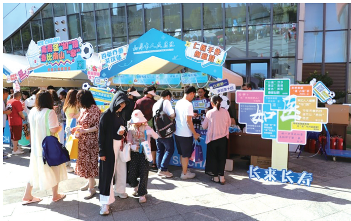
健康市集走进南通足球训练中心如皋基地。宗超越

19日,南通vs盐城的巅峰对决在南通如皋主赛场激战正酣。赛场外,一场别开生面的“长寿相伴·健康随行”市集活动同步引爆全城热情,吸引了新华社长达4分钟的直播镜头聚焦,东方卫视、江苏卫视等多家省级媒体也纷纷关注报道。