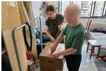
爱心人士将爱心物资送到受助人家中。

22日上午,“关爱一线牵”栏目组在崇川区新城桥街道朝晖社区、易家桥社区工作人员的陪同下一起为困难家庭送去空调扇、微波炉、电饭煲等爱心物资。