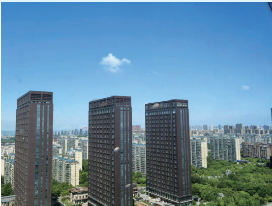
4日我市正处于副高控制区域,晴热天气重新回归。