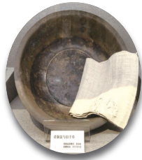
如东县革命烈士陵园所藏黄铜盆与旧手巾