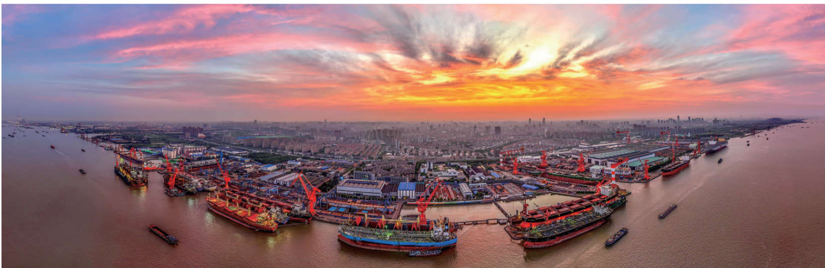
7月15日清晨，火红云霞漫染天际，船舶、岸线被描绘成鲜活的长幅画卷。许聪

7月7日傍晚，市区滨江生态绿化带被镀上金色余晖，游人们驻足欣赏落日晚霞下江面往来的船只。陆平