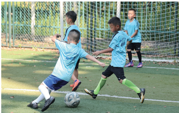
足球小将们训练的场景。