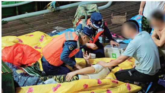
海警检查伤者情况。张杰