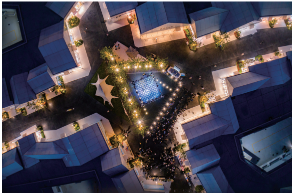
枫叶小镇 夜色阑珊 5月30日，南通中心枫叶小镇奥特莱斯，聚焦俯瞰视角下的建筑美学与夜间活力。 刘建宁