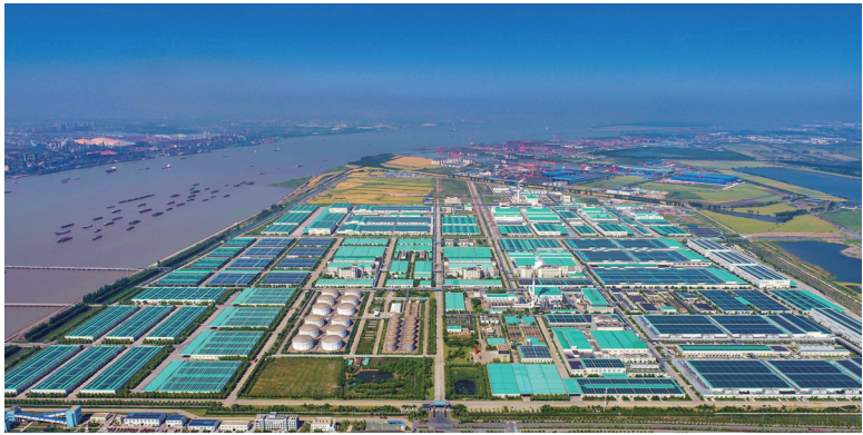
绿色恒力 2023年5月9日，恒力(南通)产业园，园区厂房整齐排列，屋顶大多铺满光伏，将阳光转化为能源，勾勒出绿色低碳、集约高效的工业图景，展现生态与产业共融的发展活力。 李从艳