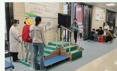
AI助力康复治疗提质增效,让患者走稳“康复”每一步。

在人才队伍建设方面,通过与国内外知名医院合作,开展学术交流和人才培养,提高医师的专业素养和业务能力。在学科建设方面,医院将继续加强重点专科和特色专科的建设,打造更多具有影响力的学科品牌。通过整合资源,优化学科结构,提高医院的整体诊疗水平。