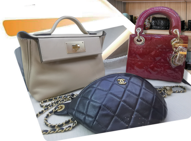
二手奢侈品店內的大牌包包。 记者周朝晖

大生创业园里的二手奢侈品店销售趋热,印象城二楼的二手小店进入试营业,市区多个旧货市场锚定打工人群,闲鱼等线上二手平台上聚集很多本地卖家……近年来,随着绿色消费理念深入人心,闲置交易市场规模日益壮大,从社区的线下寄卖、二手实体商店,到网络二手交易平台,越来越多的消费者开始青睐二手商品。