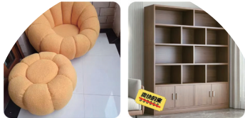
懒人沙发椅子榻榻米单人羊羔绒可躺 通体流线型设计... 全新 KUKA/顾家家居 v12 14人想要 湖北 (家具厂不开了, 38元包带走, 最后十套书柜书架) ... v37.80 5人想要 湖北 卖家信用很好