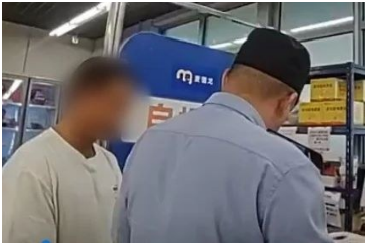
民警和超市工作人员成功拦截16万元购卡骗局。

一次性大量购买购物卡,除了企业福利或礼品采购,还有可能是诈骗团伙正在实施“洗钱”行为。25日,记者从市公安局了解到,今年以来,我市已发生多起以购物卡为媒介的电诈案件。警方提醒:批量购卡,小心有诈;发现可疑,请立即报警!